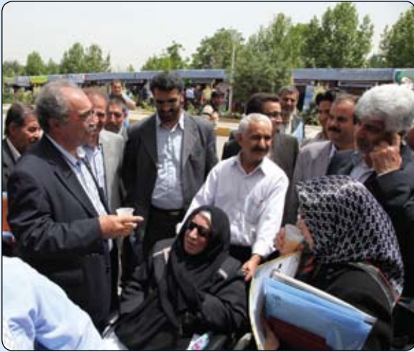
اگر می خواهید کاری بکنید امروز بکنید چون فردا دیر است

من امسال امیدوارم که کمک خیرین در سطح کشور به یکپهزار میلیارد تومان برسد، ما اگر مسأله ی آموزش و پرورش را در مملکت حل کنیم همه ی مشکلات حل شده است. عرض کردم از مدرسه سازی احساسی بهتر نیست، من به دوستان می گویم یک مدرسه بسازید کوچک یا بزرگ خودتان در این مسیر راه می افتید و خودتان ادامه می دهید.